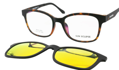
TR90 8210 - C3 Marron Ecaille Clip Miroir Orange 53□18-140