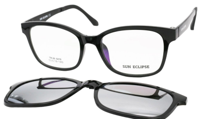
TR90 8210 - C1 Noir Clip Miroir Argent 53□18-140