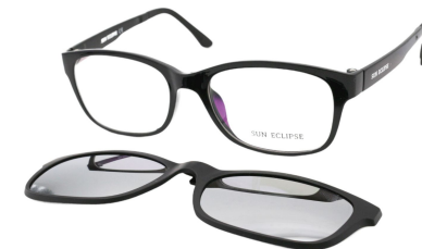
TR90 8215 - C1 Noir Clip Miroir Argent 53□17-140