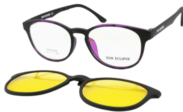
TR90 8204 - C3 Ecaille Violet Clip Vision Nuit 49□17-146