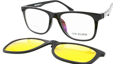
TR90 8202 - C2-1 Noir Brillant Clip Vision Nuit 51□17-146