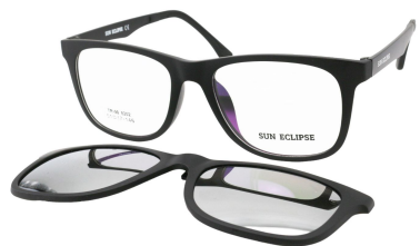
TR90 8202 - C1 Noir Clip Miroir Argent 51□17-146