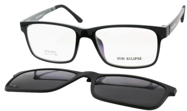
TR90 8212 - C4 Noir Gris Clip Noir 55□17-146