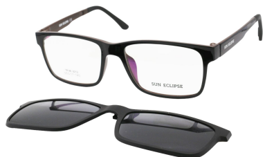
TR90 8212 - C3 Noir Marron Clip Noir 55□17-146