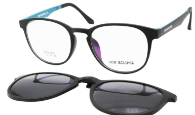
TR90 8203-C5 Noir Mat Bleu Ciel Clip Noir 51□19-146