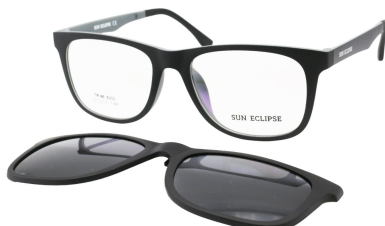
TR90 8202 - C6 Noir Mat Gris Clip Noir 51□17-146