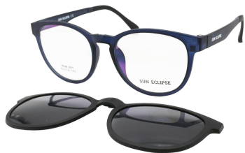
TR90 8211 - C4 Marine Clip Noir 53□18-140