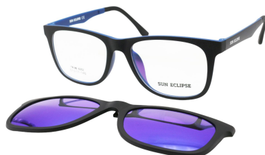
TR90 8202 - C5 Noir Mat Bleu Clip Miroir Bleu 51□17-146