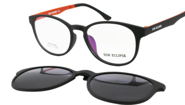
TR90 8204-C6 Noir Mat Orange Clip Noir 49□17-146