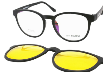
TR90 8211 - C2-1 Noir Mat Clip Vision Nuit 53□18-140