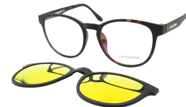
TR90 8211 - C3 Marron Ecaille Clip Miroir Orange 53□18-140