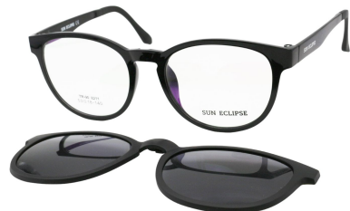
TR90 8211 - C1 Noir Clip Miroir Argent 53□18-140