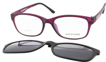
TR90 8215 - C6 Violet Clip Noir 53□17-140

MONTURES OPTIQUES EN TR90 GRILAMID AVEC FACE AIMANTÉE SOLAIRE - CAT.3 UV 400