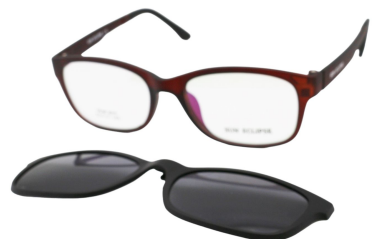
TR90 8215 - C3 Marron Clip Noir 53□17-140