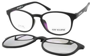
TR90 8204 - C1 Noir Mat Clip Miroir Argent 49□17-146

MONTURES OPTIQUES EN TR90 GRILAMID AVEC FACE AIMANTÉE SOLAIRE - CAT.3 UV 400