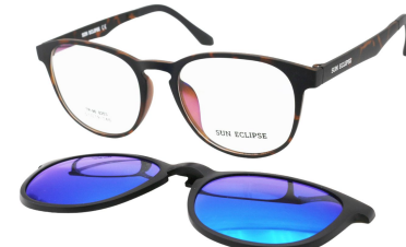
TR90 8203 - C2 Marron Ecaille Clip Miroir Bleu 51□19-146