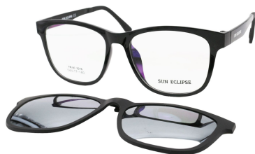
TR90 8216 - C1 Noir Clip Miroir Argent 54□17-140