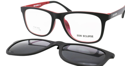
TR90 8202 - C4 Noir Mat Rouge Clip Noir 51□17-146