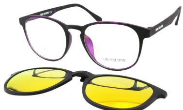
TR90 8203 - C3 Violet Ecaille Clip Miroir Orange 51□19-146