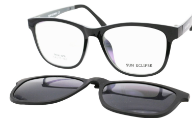
TR90 8216 - C3 Noir Gris Clip Noir 54□17-140