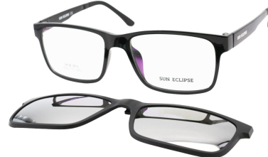
TR90 8212 - C1 Noir Clip Miroir Argent 55□17-146