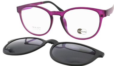
TR90 8211 - C5 Violet Clip Noir 53□18-140