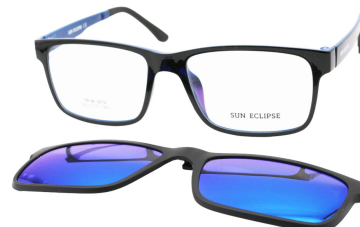
TR90 8212 - C5 Noir Bleu Clip Miroir Bleu 55□17-146