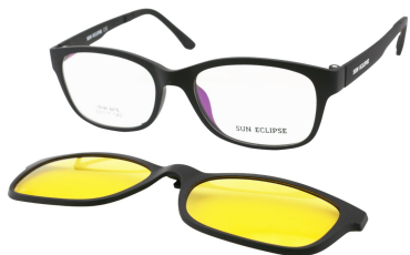
TR90 8215 - C2 Noir Mat Clip Vision Nuit 53□17-140