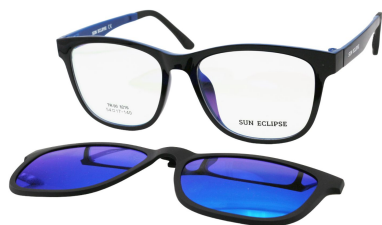
TR90 8216 - C4 Noir Bleu Clip Miroir Bleu 54□17-140