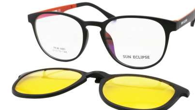
TR90 8203 - C6 Noir Mat Orange Clip Vision Nuit 51□19-146