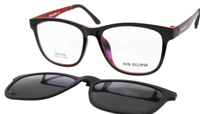
TR90 8216 - C5 Noir Bordeaux Clip Noir 54□17-140