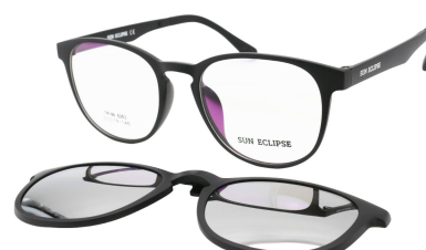
TR90 8203 - C1 Noir Mat Clip Miroir Argent 51□19-146