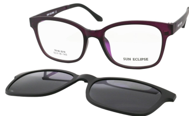
TR90 8210 - C5 Violet Clip Noir 53□18-140