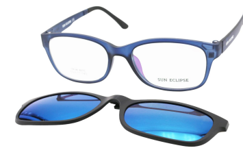
TR90 8215 - C5 Bleu Clip Miroir Bleu 53□17-140