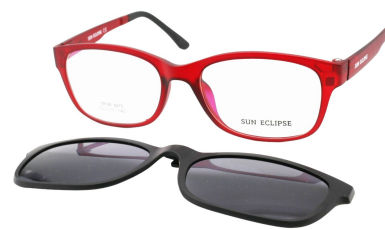
TR90 8215 - C4 Bordeaux Clip Noir 53□17-140