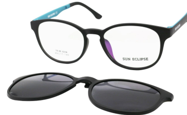
TR90 8204-C5 Noir Mat Bleu Ciel Clip Noir 49□17-146