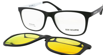
TR90 8202 - C3 Noir Mat. Blanc Clip Miroir Orange 51□17-146