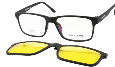
TR90 8212 - C2-1 Noir Mat Clip Vision Nuit 55□17-146