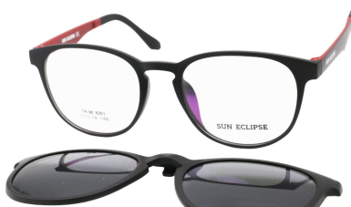
TR90 8203 - C4 Noir Mat Rouge Clip Noir 51□19-146