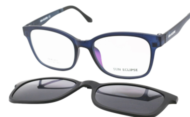
TR90 8210 - C4 Marine Clip Noir 53□18-140