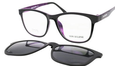
TR90 8216 - C6 Noir Violet Clip Noir 54□17-140