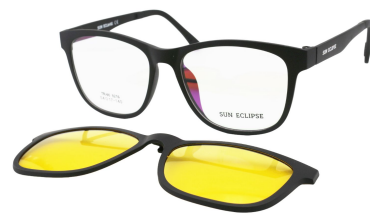
TR90 8216 - C2-1 Noir Mat Clip Vision Nuit 54□17-140