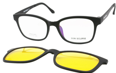
TR90 8210 - C2-1 Noir Mat Clip Vision Nuit 53□18-140